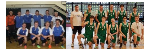
SPORT- ÉS CSAPATVERSENY